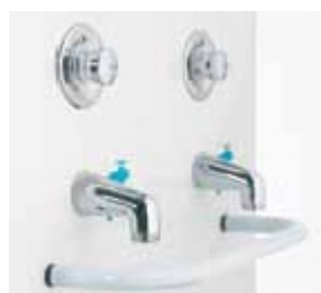
Robinetts eau potable