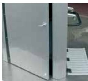
Portes de services fermant à clés