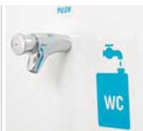
Robinet de rinçage avec régulateur de débit