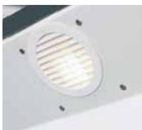
Éclairage automatique système crépusculaire