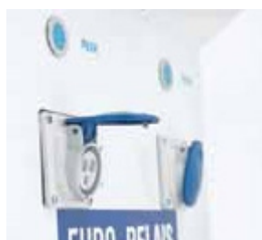
Prises électriques conformes aux normes européennes