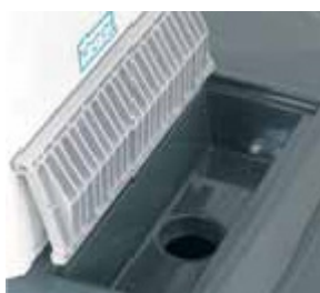
Vidange eau usée