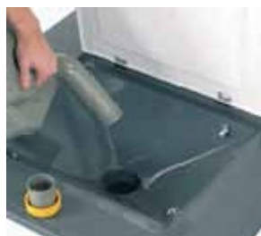
Vidange Wc avec rinçage intégré